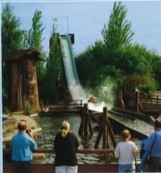
Wildwasserfahrt: Im Einbaum über atemberaubende Stromschnellen.