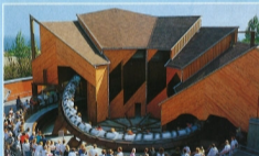
Metroliner: der schnellste Zug auf engstem Radius. Wow!! Einmalig in Europa!

HANSA-PARK i Sierksdorf. Eventyr – action – attraktioner! Mange mestendte og flere af dem overdøkket. Men alle uforglemmelige. Så tryllet er varer net ind i hverdagen med oplevelser, som går i blodet: "Rendezvous im Loop". Et møde mellem himmel og jord, hvor Superrollercoasteren "Nessie" styrter sig i et loop. Og lige nedenunder Altekspresen "Rasender Roland". Hvilvinn.