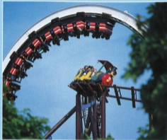
Einemalig auf der Welt: 2 Achterbahnen im Loop