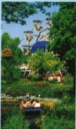
Boote gleiten durch ein Blumenmeer voll bezaubernder Farben und Düfte.