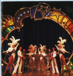
Das Berliner Showballett in Norddeutschlands größtem Varieté-Theater.

I HANSA-PARK optræder kunstnere fra hele verden. Med forestillinger, som er helt i top: motorcykel-akrobatik Lady-Fakir-Show, Acapulco-High-Diving-Eagles. Nyhed: varietéshowet "Magic Las Vegas '95". En internationalt revy med dans, akrobatik og illusion.