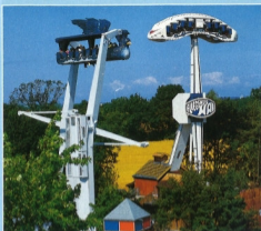
Nur für starke Nerven: Freier Fall im Sturmvogel aus 20 m Höhe und 7x kopfüber im Fliegenden Hui.