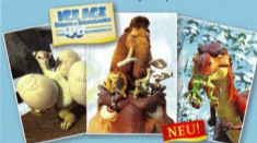
„Ice Age – Morgendämmerung der Dinosaurier“ im FantasticCinema