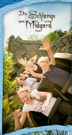
Die Schlange von Mägard