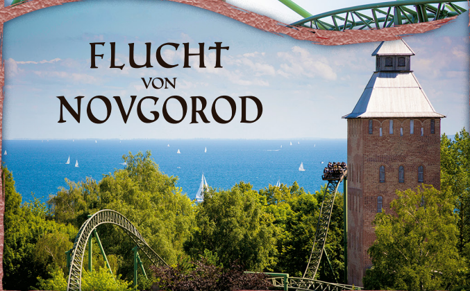
FLUCHT VON NOVGOROD