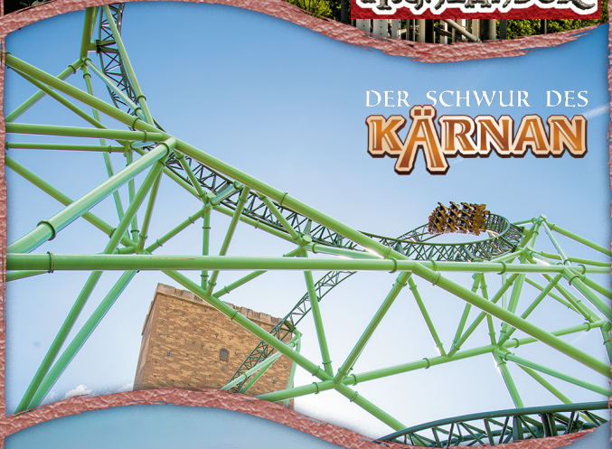
DER SCHWUR DES KÄRNAN